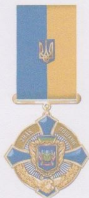
Нагрудний знак «ЗНАК ПОШАНИ»