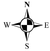
План існуючого використання території